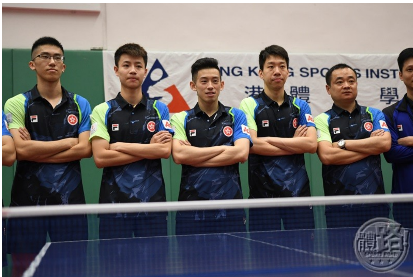
「2017世界乒乓球錦標賽」香港隊參賽名單：